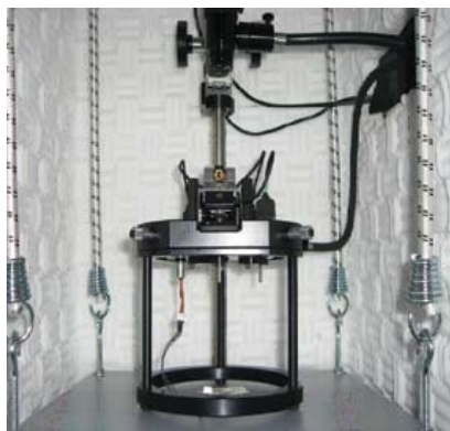
Figura 3 Fotografia do equipamento AFM/STM. Uma estrutura comum permite escolher a opção AFM (a que se vê na imagem) ou a opção STM

O AFM torna-se vantajoso quando se pretendem analisar superfícies que não sejam condutoras. Neste caso, a ponta (usualmente de silício) varre a superfície da amostra (direcções X e Y) a uma distância controlada (direcção Z). O movimento é também controlado por um dispositivo piezoeléctrico conhecido por scanner . A ponta é suportada por uma haste flexível, o cantilever , onde incide um laser cujo feixe é reflectido para um fotodetector . As alterações na interacção da ponta com a superfície induzem diferentes deflexões no cantilever que por sua vez modifica o ângulo de incidência do feixe do laser. O fotodetector capta todas as mudanças de posição do feixe do laser, transformando-as em sinal eléctrico que realimenta o scanner piezoeléctrico.