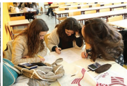
Fotografias do ambiente vivido nas provas. Em cima, à esquerda, equipa classificada em 1.º lugar